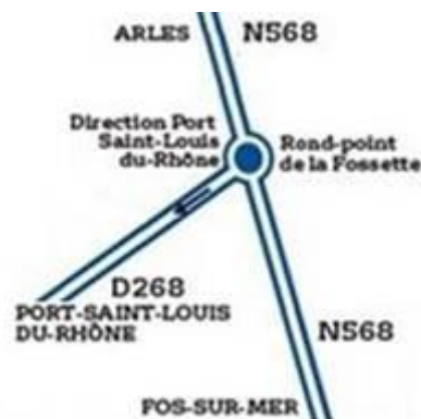
Figure 1 : Rond-point de la Fossette

L'accès se fait à partir du rond-point de la Fossette à Fos-sur-Mer sur la N568.