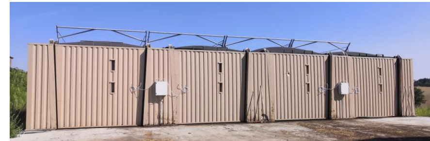
Site Expérimental Cluzel Energie (Département Allier 03) construit par Valotech Energies. En exploitation depuis Avril 2021